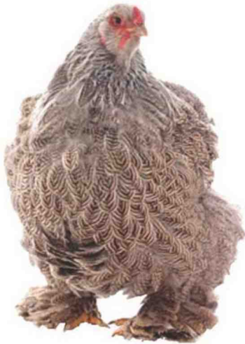
BEC PLUS ULTRA